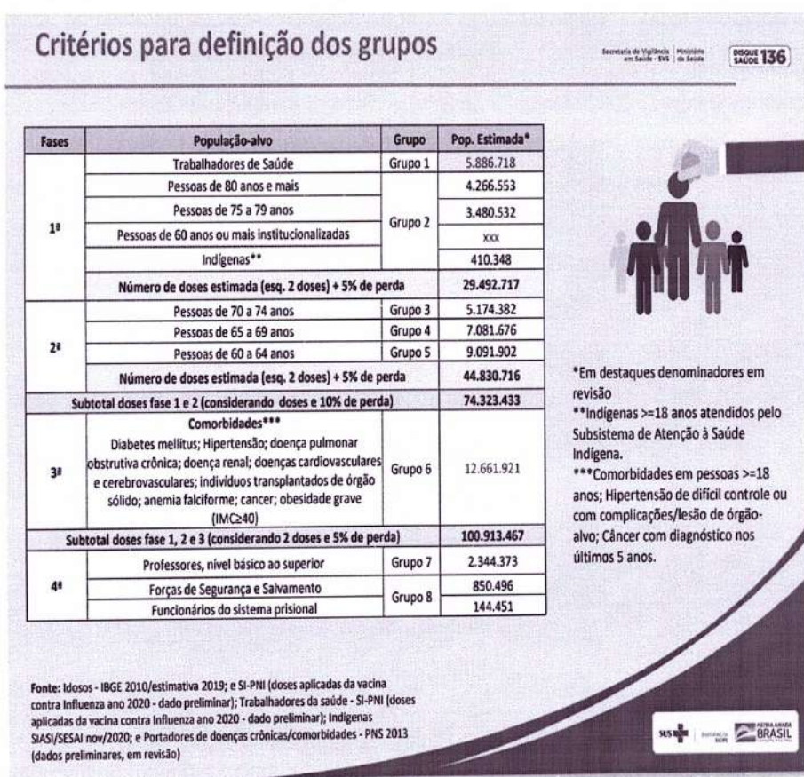
Figura 01 - População estimada dos grupos prioritários, Brasil.

Também a vacinação da população indígena aldeada será realizada pelas equipes do Subsistema de Atenção à Saúde Indígena, in loco.